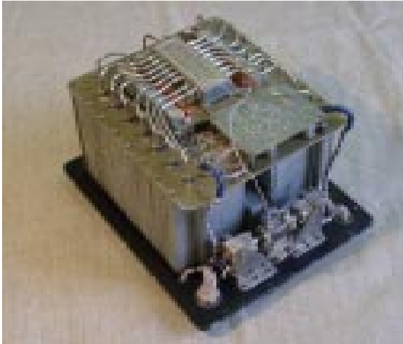
Рис. 3. Многоканальный радиометр 3-мм-диапазона (без корпуса)

Разработанный многоканальный радиометр (рис. 3) для системы радиовидения «Зір» выполнен в герметичном корпусе, а большинство его